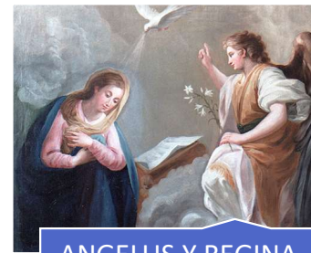
ANGELUS Y REGINA COELI