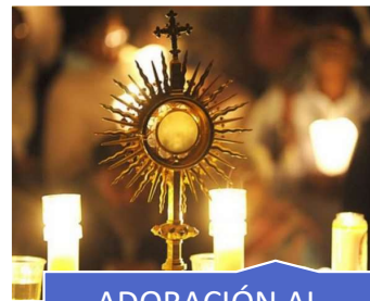
ADORACIÓN AL SANTÍSIMO